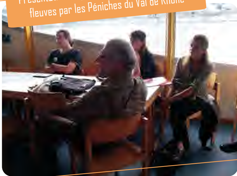
Présentation du jeu de plateau sur l'eau et les fleuves par les Péniches du Val de Rhône