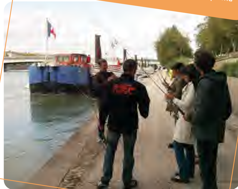
Découverte du street fishing avec la Fédé de pêche